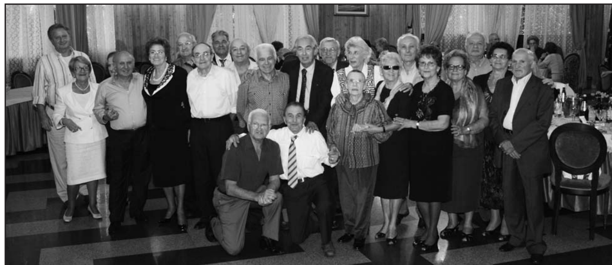
Foto ricordo dei coetanei del 1935 nell'accogliente sala del Green Park Boschetti.

Il saluto finale, con un omaggio floreale alla signora presenti, con l'arrivederci all'anno prossimo.