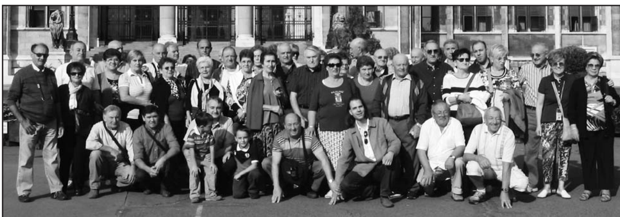
I Fanti con gli amici in gita in Ungheria.

STUDIO DENTISTICO Dott. CICALI PALMERINO