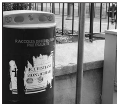
Alcuni degli avvisi elettorali a lutto che a quattro mesi di distanza dall'esito elettorale di giugno deturpano ancora un po' ovunque la città di Montichiari. La situazione reclama un'operazione di pulizia.