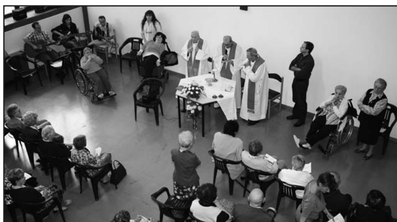
La celebrazione della S. Messa.